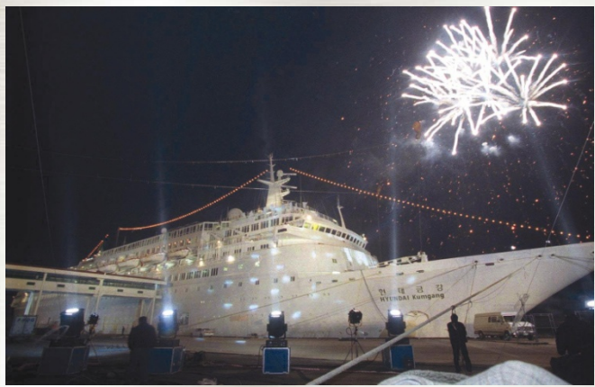
● 해로관광 개시('98년 11월)