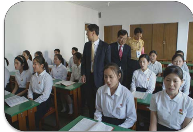
교육기자재 지원 및 615공동수업