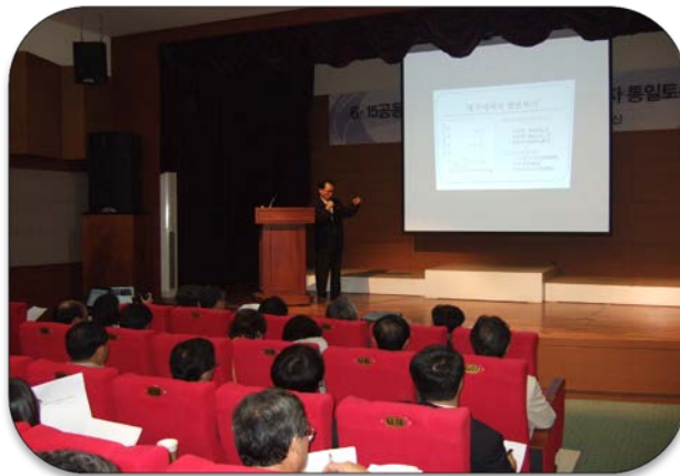
사례1. 이공계분야 _ 나노토론회 (경제협력 및 기술협력)