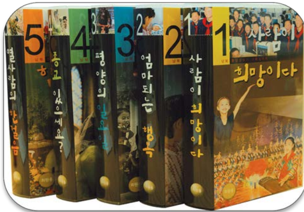
동질성 찾기 5부작 시리즈