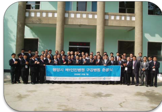
사례4. 의료분야 _ 치과병동 (장비문제가 선결되어야함)