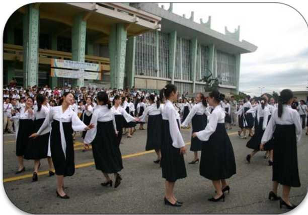
인천세계육상선수권대회 북측참가, 겨레하나와의 연환모임 (피치 지원의 성과)