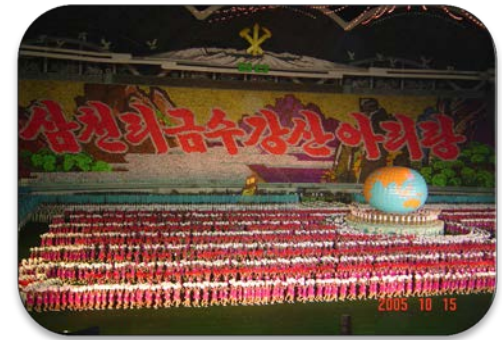
아리랑 공연 참가 (2005년 4000명 규모)