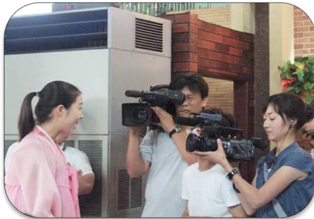
사례3. 문화분야 _ 조선요리100선 (경제적지원 및 현실가능한 문화협력)