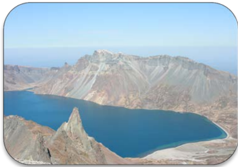
백두산 아스팔트 피치지원 (60억원 상당)