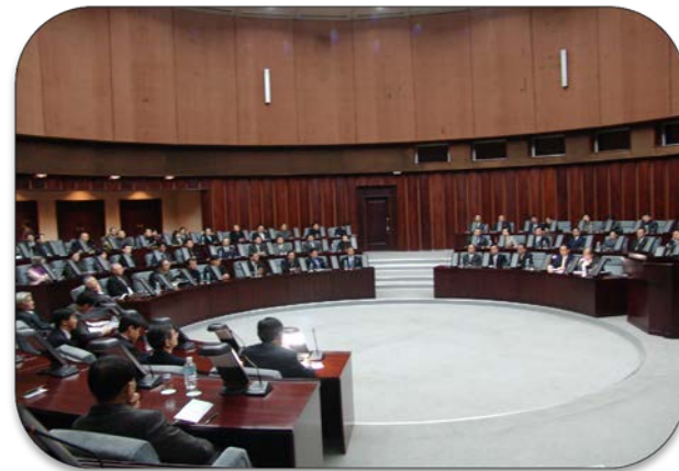
사례2. 정치분야 _ 평양좌담회 (공동성명을 낼 수 있는가의 문제)