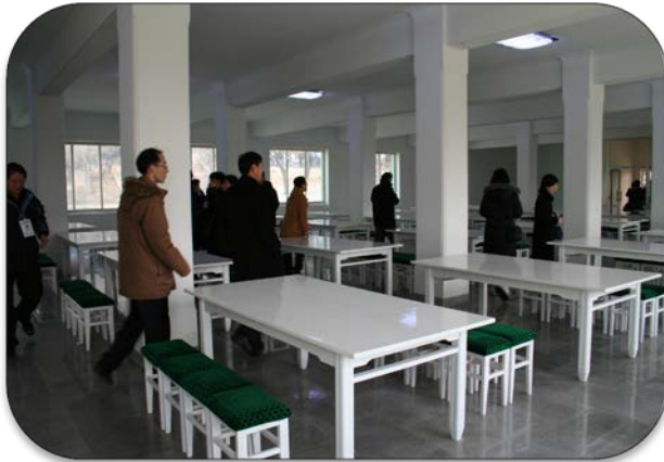
김일성종합대학 현대화 및 평양좌담회, 금강산 나노토론회