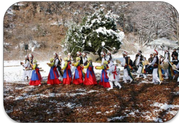
안성 남사당패의 평양공연 (장류공장 지원의 성과)