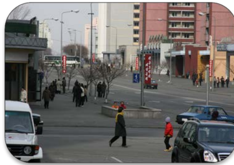
창광거리 현대화 평양 페인트지원 (10억원 상당)