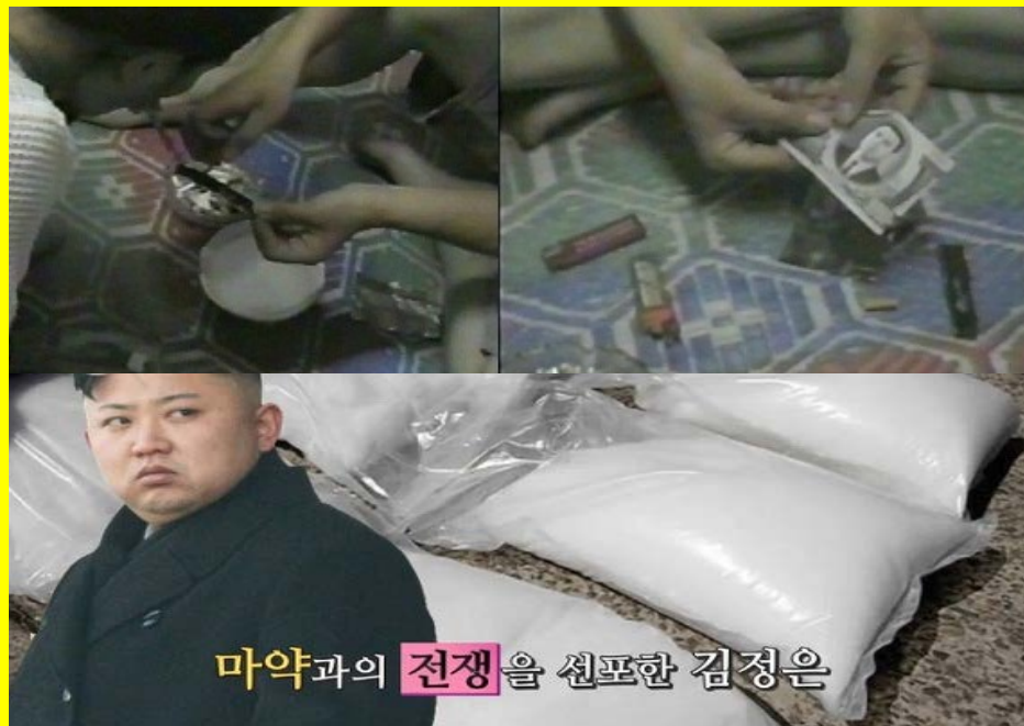
마약과의 전쟁을 선포한 김정은