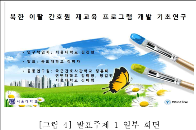
[그림 4] 발표주제 1 일부 화면