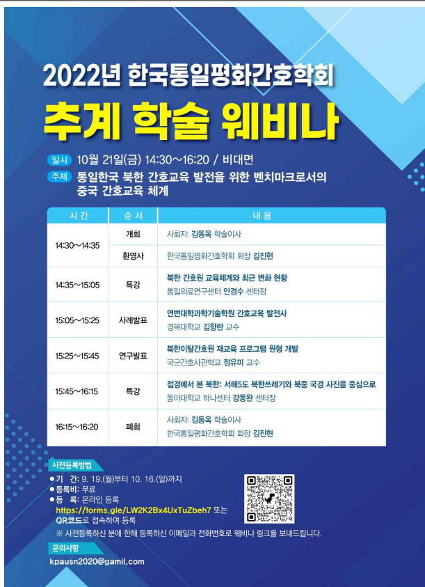
[그림 2] 2022 한국통일평화간호학회 웹포스터