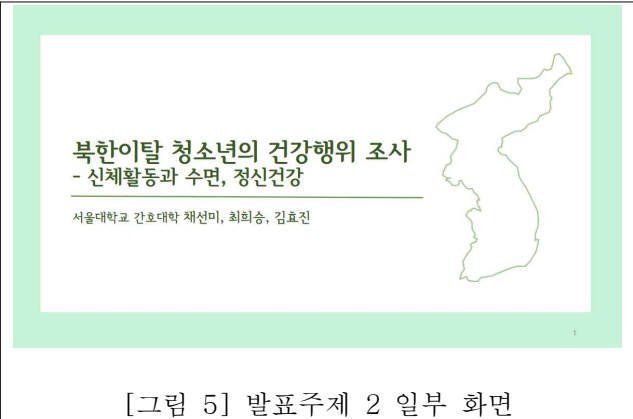
[그림 5] 발표주제 2 일부 화면