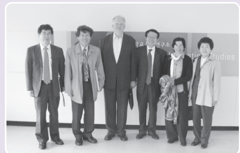
Ulrich Beck 교수 내외