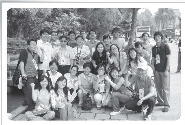
사진 1. 선죽교 앞에서