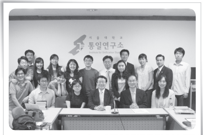
사진 2. 제3기 수료식