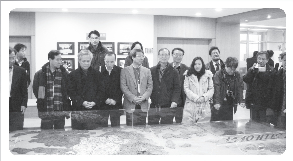
사진 1. 개성공업지구 개발 현황 브리핑(현대아산)