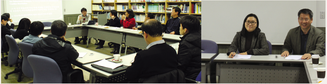
연구원 세미나실에서 진행 중인 HK평화인문학사업단의 콜로키움

서울대학교 통일평화연구원 HK평화인문학연구단은 평화연구와 관련한 국내외 학자들 및 평화운동가, 평화단체의 경험들을 발표, 공유함으로써 새로운 '평화학' 수립의 기초를 만들려는 연구발표회를 진행하고 있다.