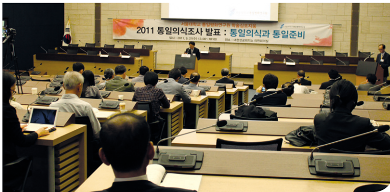
상공회의소 의원회의실에서 개최된 2011 통일외식조사 발표

서울대학교 통일평화연구원은 2011년 9월 21일(수) 오후 13시~18시에 대한상공회의소 의원회의실에서 “통일외식과 통일준비”의 제하에 매년 실시하는 ‘통일외식조사’의 2011년도 내용을 발표하는 학술회의를 개최하였다. 이번 학술회의는 통일외식조사의 결과와 이의 해석을 통해 우리 사회가 좀 더 높은 수준의 통일준비역량을 갖추게 되기를 기대한다는 박명규 원장의 개회사로 시작되었다. 이어진 축사에서 동반성장위원회 정운찬 위원장은 본단의 상처를 치유하고 새로운 통일한반도를 이룩하는 것이 미래전략의 핵심이며, 이의 밑거름으로서 우리 국민들의 통일외식이 어디로 가고 있는지를 보여주는 통일외식조사가 중요한 의미를 지닌다는 견해를 밝혔다. 김병섭 교수의 사회로 시작된 1부에서는 옆의 행사표와 같이 2011 통일외식조사 공동연구자들의 각 분야의 발표가 이어졌으며, 조사의 의의와 방향, 결과에 대한 사회자의 말로 마감되었다. 이어진 2부는 통일외식조사의 결과 발표의 연구의 함의와 그에 대한 다방면의 논의가 패널들 사이에 이루어진 의미있는 자리로 되었다.