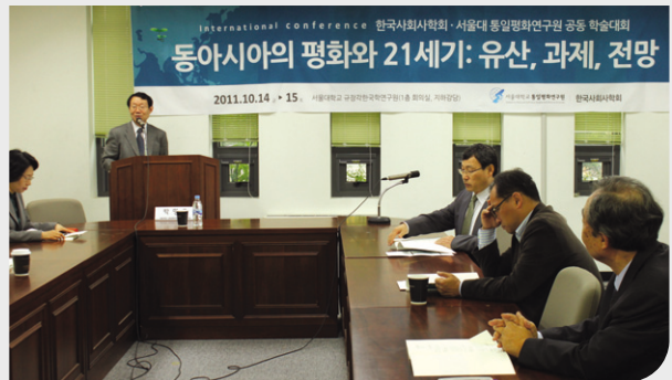
서울대학교 규장각 회의실에서 열린 공동학술회의

제1일에는 한국사회사학회 회장을 맡고 있는 성신여대 황경숙 교수의 개회사와 본원 박명규 원장의 환영사로 시작되었다. 이날은 3세션으로 나누어 진행되었는데, 첫 세션에서는 평화사상에 대한 논의로 강유위의 대동사상, 함석헌의 씨알사상, 불교의 평화사상에 대해 발표하였다. 두 번째 세션에서는 안중근, 다케우치 요시미, 고토쿠 슈스이의 근대 평화론에 대해 각각 발표되었으며 세 번째 세션에서는 냉전체제 전후와 관련한 일본의 평화운동, 한국전쟁의 문제 등에 대해 논의 되었다.