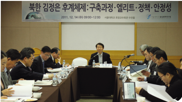
호암교수회관 수련홀에서 개최된 출간기념 학술회의

서울대 통일평화연구원은 ‘북한 김정은 후계체제: 구축과정·엘리트·정책·안정성’이란 주제의 학술회의를 개최하였다. 동명으로 출간된 본원의 [북한 김정은 후계체제: 구축과정·엘리트·정책·안정성] 통일학연구 시리즈 10권의 출판기념의 의미도 있었다. 정성장 세종연구소 수석연구위원은 김일철 전 인민무력부장과 오극렬 국방위 부위원장의 사례를 들어 김정은 후계체제 구축에 소극적이거나 적극적인 역할을 하지 못한 군부 엘리트들이 조기 퇴진하거나 위상이 하락하는 경향을 보이고 있다고 주장했다. 정 연구위원은 “조기 퇴진을 강요당한 대표적인 경우는 김일철을 들 수 있다”며 “그는 2009년 2월 인민무력부장에서 인민무력부 제1부부장으로 강등되는데 이어 2010년 5월에는 ‘연령상의 관계 (80세)’로 모든 직책에서 해임되는 불운을 겪게 됐다”고 설명했다.