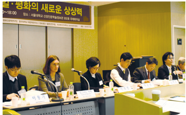
서울대 신양인문학술정보관 국제회의실에서 개최된 공동 국제학술회의