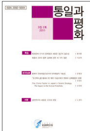
『통일과 평화』 제3집 2호