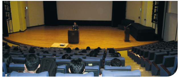
서울대 문화관 중강당에서 진행된 새터민 문화마당 중 강연시간

체 ‘바닥소리’의 공연이 시작되었다. ‘닭들의 꿈, 날다’라는 제목의 이 공연은 전통적인 판소리의 형식을 빌렸으나, 판소리에 익숙하지 않은 일반 대중이 쉽게 다가갈 수 있도록 보다 쉬운 언어를 활용하고 장르를 현대적으로 재해석한 것이 특징이었다. 하늘을 나는 꿈을 가진 닭이 그 꿈을 이루는 과정을 익살맞게 보여줌으로써, 청소년들이 쉽게 공감할 수 있는 ‘꿈’과 관련된 주제를 담았다. 작품에 등장하는 비무장지대는 한반도의 독특한 현실을 반영하고 있었는데, 분단의 비극이라는 배경 속에서 아픔을 딛고 꿈을 향해 나아가는 주인공들의 모습에 공감했는지, 한겨레중고등학교 학생들은 공연 내내 열광적으로 작품에 반응하였다. 공연이 마무리된 후, 공연단은 작품의 줄거리를 주제로 학생들에게 퀴즈를 냈는데, 이를 맞춘 학생들에게는 이번 공연의 음반이 선물로 제공되었다. 멋진 공연을 선사해준 공연단과 함께 단체 사진을 찍고, 저녁 식사를 하는 것으로 전체 일정이 마무리되었다.