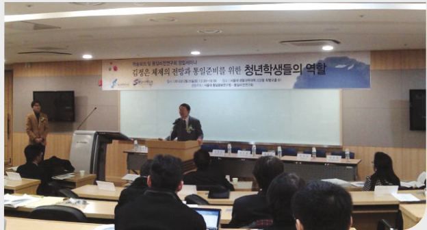
서울대 생활과학대학 최병호 홀에서 개최된 공동학술회의

제1회의는 김병로 교수의 사회와 함께 이승열 교수의 '김정은 체제의 북한전망'과 변상정 박사와 최경희 연구원의 공동연구인 '김정은 체제의 안정성과 김정은 체제의 지식경제형 강국의 의미와 전망'에 관한 발표와 토론이 이루어졌다. 제2회의에서는 최규동 대표의 사회로 '통일시대를 준비하는