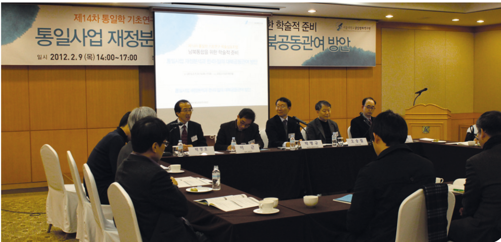
호암교수회관 목련홀에서 개최된 제14차 통일학 과제발표회