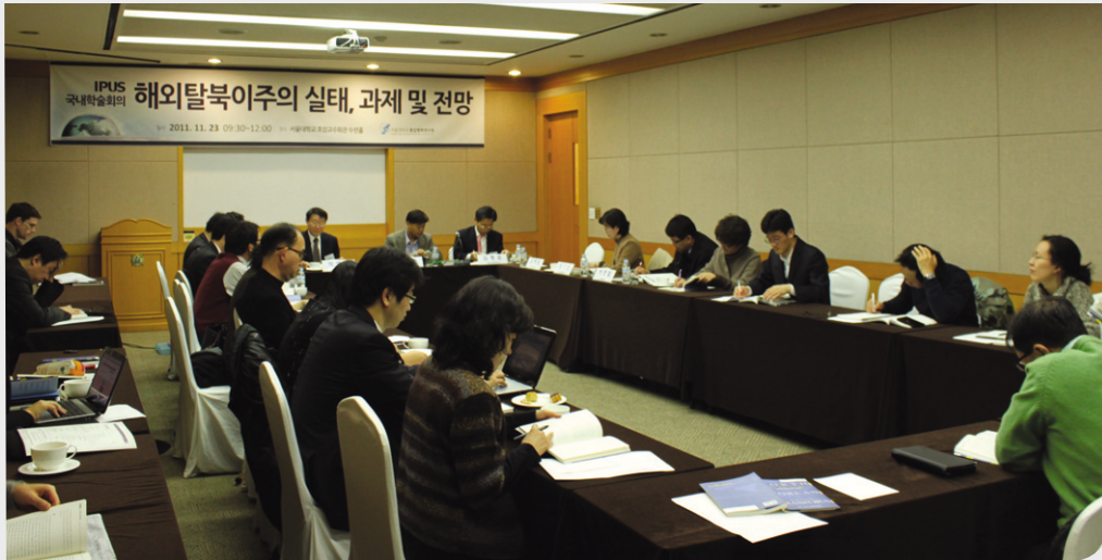
호암교수회관에서 개최된 출간기념 학술회의

통일평화연구원은 '해외탈북이주의 실태, 과제, 전망'이라는 주제로 2011년 11월 23일에 호암교수회관 수련홀에서 학술회의를 진행하였다. 본 연구원은 매년 통일학 연구를 공모하고 지원하며 그 연구결과로 단행본을 출간하고 있다. 북한주민의 해외탈북이주와 정착실태를 연구하여 11월 22일에 출간된 통일학연구 9호 [노스 코리안 디아스포라]를 중심으로 각 분야의 전문가들과 논의하였다.