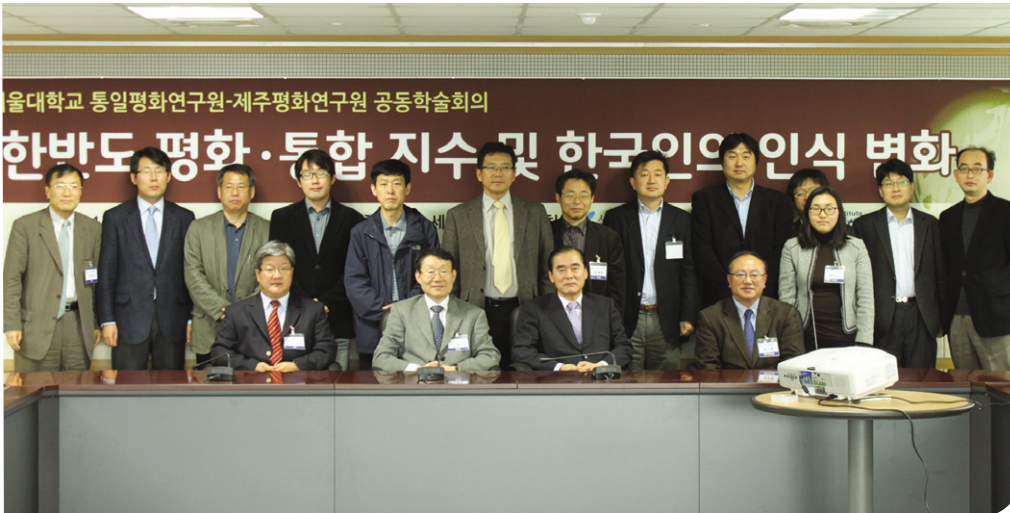
제주평화연구원 회의실에서 개최된 공동학술회의