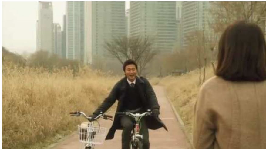
(드라마 「아내의 자격」 한장면 )

아내가 방으로 들어갔다. “아줌마 불륜이야기는 왜 보누?...” 아내를 쫓아낸 것은 「아내의 자격」이라는 이른바 종편채널 드라마였다. 여러 가지 이유(?)로 -모든 사람이 공감하지는 않겠지만- 채널을 돌릴 때 특정 번호부터는 건너뛰곤 했지만, 이 드라마 앞에서는 예외였다. 이 드라마는 내가 이 연구에서 하고 싶은 이야기를 절묘하게 담고 있었다. 나는 이 연구에서 한국에서 엿볼 수 있는 페미니즘 안보 또는 평화학에 대하여 이야기 하고자 한다. 흥미롭게도 「아내의 자격」은 내가 꿈꾸고자 하는 페미니즘 안보 또는 평화학의 모색을 형식적으로·내용적으로 담고 있다. 그래서 나는 이 드라마는 드라마에 불과하다는 통념을 해배(解配)하면서 한국에서 페미니즘 안보 또는 평화학 논의로 연결하고자 한다.