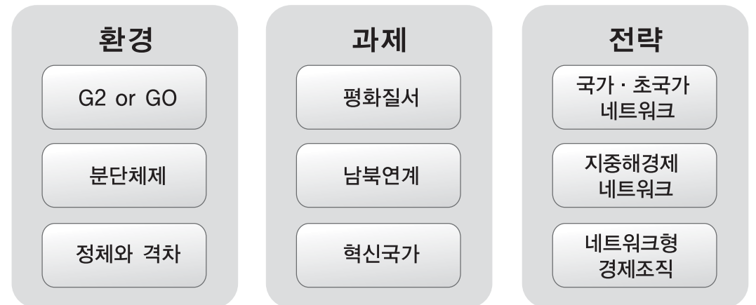
<그림 2> 한반도경제 모델의 구성요소

'한반도경제' 모델에서 삼중의 과제와 대응하는 네트워크는 국가·초국가 네트워크, 지중해경제 네트워크, 혁신적 네트워크 경제조직 등으로 구성된다. 국가·초국가 네트워크는 국가 내부와 국가 간에 존재하는 제도와 정책결정 과정에서 존재하는 공유된 연결망이다. 지중해경제 네트워크는 한국·북한·중국·일본 등의 여러 도시들 사이에 존재하는 반복적·지속적인 연결망이다. 혁신적 네트워크 경제조직은 대기업·중소기업간, 지역간 생산력 격차에 대응하는 조직간·지역간 연결망이다(그림 2).