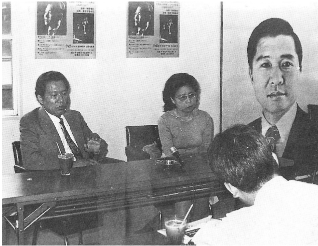
*출처: 『伊伊桑의 音樂世界』

그 첫 행동이 1974년 8월 15일 일본에서 직접 기자회견을 가지고(사진1), 남한으로 납치되어 고문당한 경험을 처음으로 폭로한 것인데, 박정희정부의 끔직한 인권침해를 알려서 일본여론에 김대중 구출을 호소하고자 했던 것이다. 32) 이런 활동이 알려지자 윤이상은 1976년 일본에서 (10여년처럼) 남한의 국가정보원에 의해 다시 납치될 위험을 겪게 되는데, 스스로 1976년을 ‘충격의 해’라고 토로한다. 도쿄에서 있었던 ‘윤이상 콘서트’에는 윤이상을 보호하기 위해 일본경찰이 우에노 문화회관을 뺑뺑이 경호하는 살벌한 상황이 벌어지기도 했다. 33)