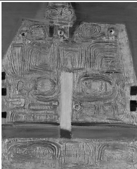
〈그림 5〉 윤명로, 〈문신〉 시리즈 중, 1963.