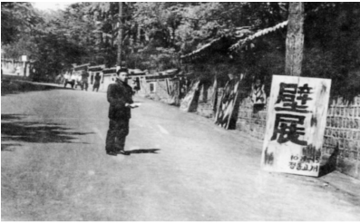
〈그림 3〉 벽전 개최 모습, 1960.