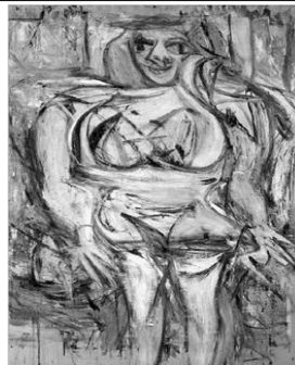
〈그림 6〉 빌렘 드 쿠닝, 〈여인 III〉, 1953.