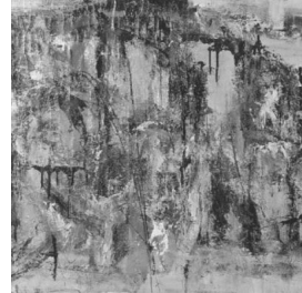
〈그림 4〉 장선순, 〈59-B〉, 1959.